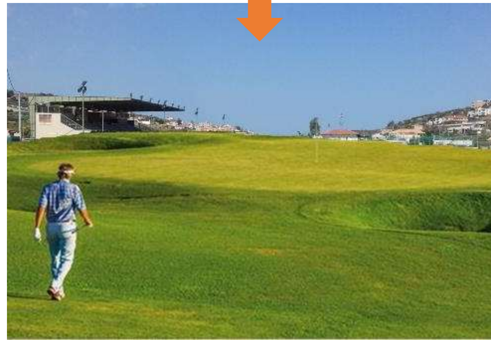
Εικόνα 8: γήπεδο γκολφ