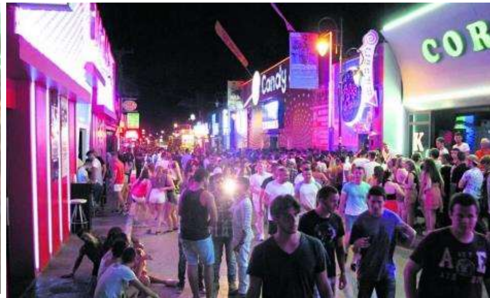
Εικόνες 21-22: νέα κέντρα διασκέδασης