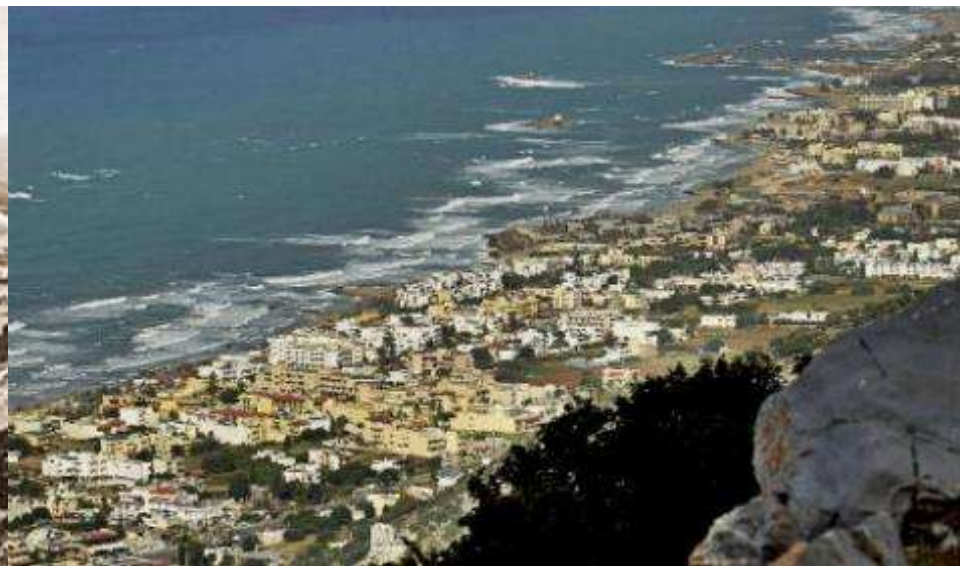
Εικόνες 26-27: η περιοχή των Μαλίων το 1966 και σήμερα