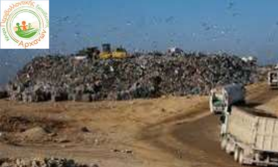
Εικόνες 15-16: δημιουργία νέων χώρων απόθεσης απορριμμάτων