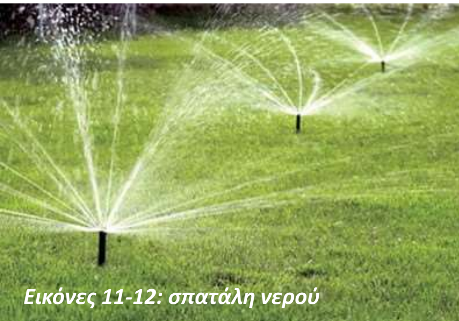
Εικόνες 11-12: σπατάλη νερού