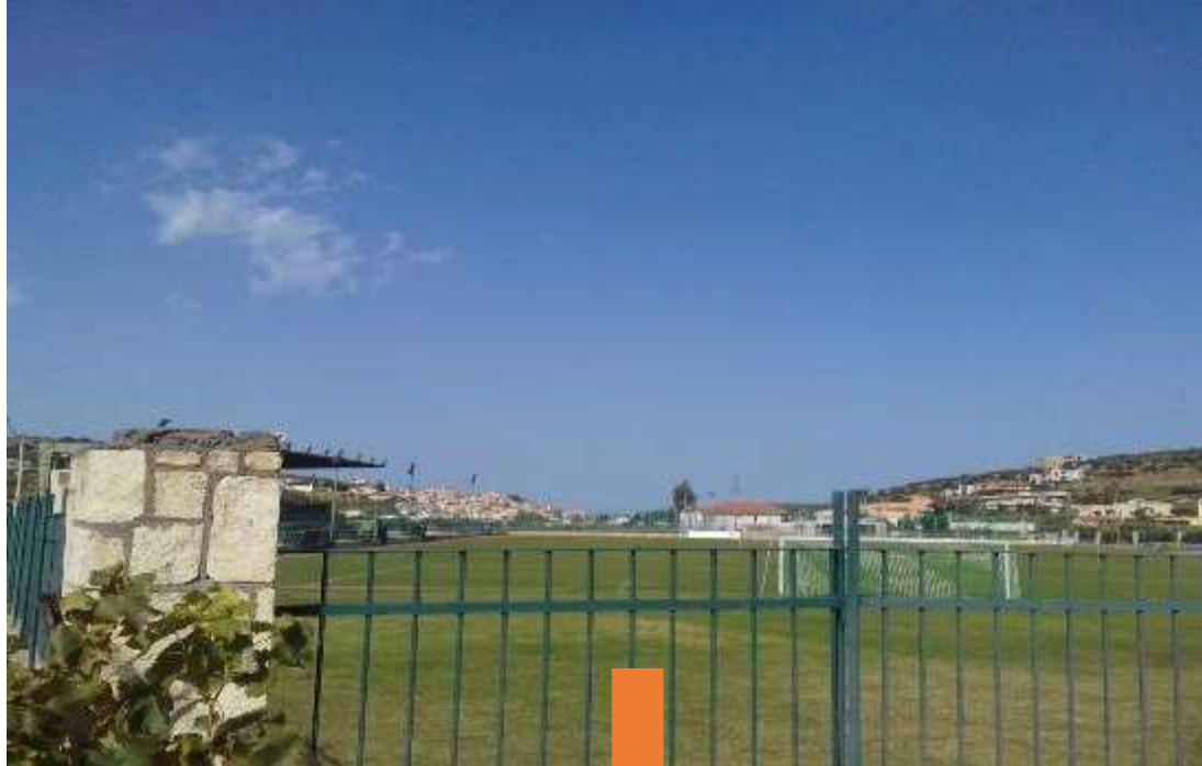
Εικόνα 7: γήπεδο Αρχανών