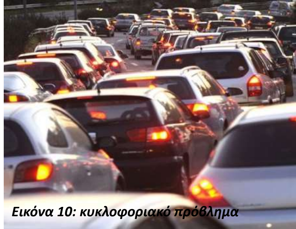
Εικόνα 10: κυκλοφοριακό πρόβλημα