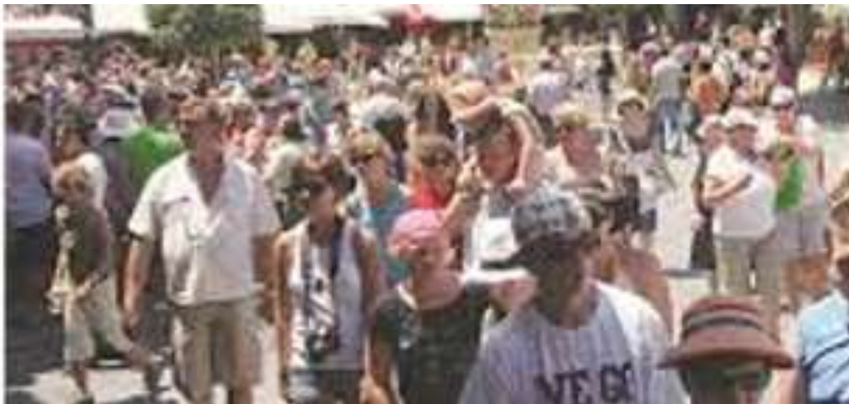
Εικόνες 13 & 14

Θα μπορούν να επισκεφτούν το μικρό χωριό μας των 4.000 κατοίκων μέχρι και 100.000 τουρίστες μέσα στην καλοκαιρινή περίοδο