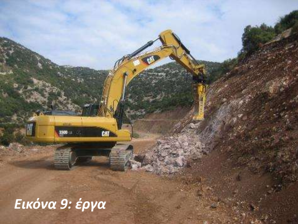
Εικόνα 9: έργα