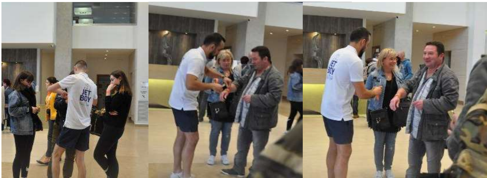
Εικόνες 23 – 25