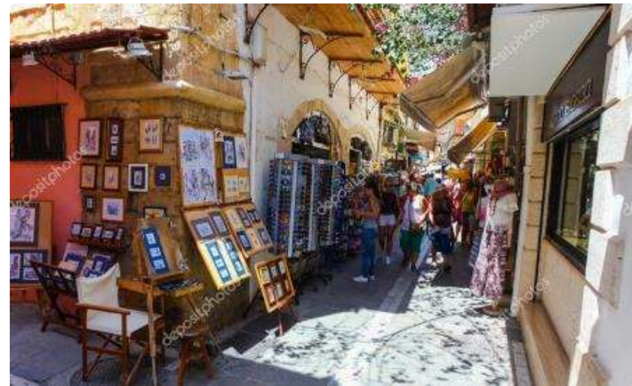
Εικόνες 19-20: νέες επαγγελματικές ευκαιρίες