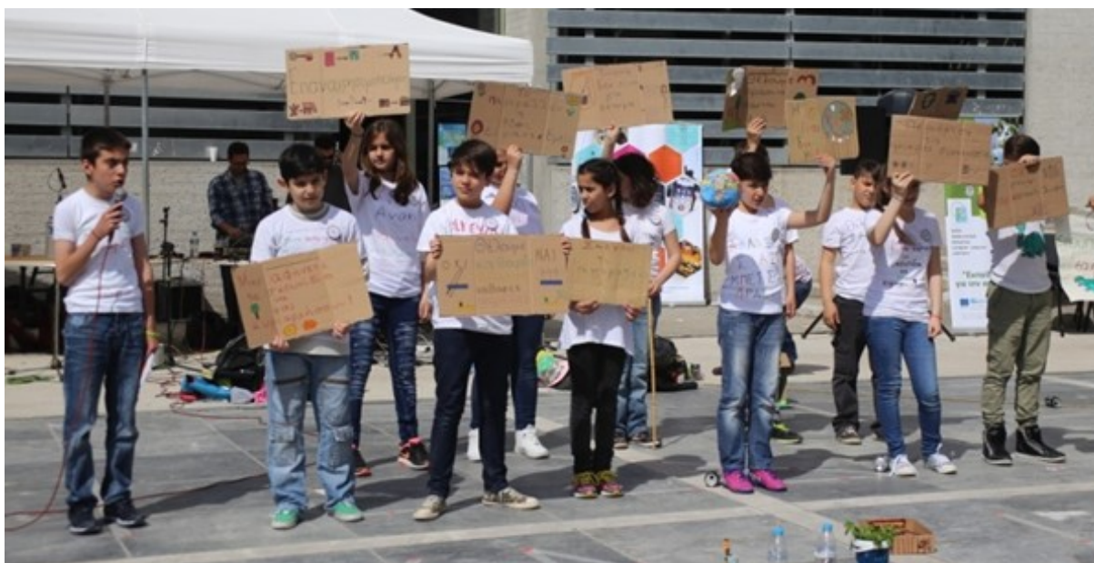
Μαθητική παρουσίαση στον αύλειο χώρο του Δημαρχείου

Υπάρχει πάντα η δυνατότητα υλοποίησης του προγράμματος κατά την διάρκεια δυο σχολικών ετών.