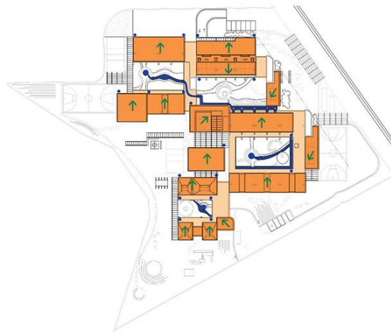
Βέλτιστη ηλιοπροσασία το καλοκαίρι με 100% νότιο προσανατολισμό.