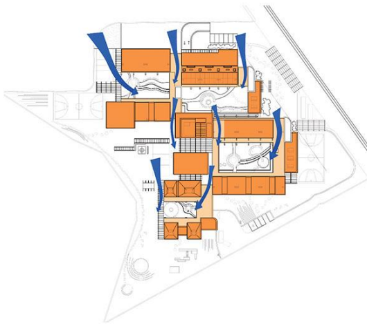
Το στοιχείο του νερού και σύστημα συλλογής αβρύνων.