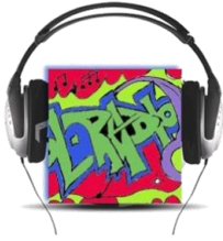
ΕΠΙΣΤΗΜΟΝΙΚΗ ΕΤΑΙΡΕΙΑ «European School Radio, Το Πρώτο Μαθητικό Ραδιόφωνο»