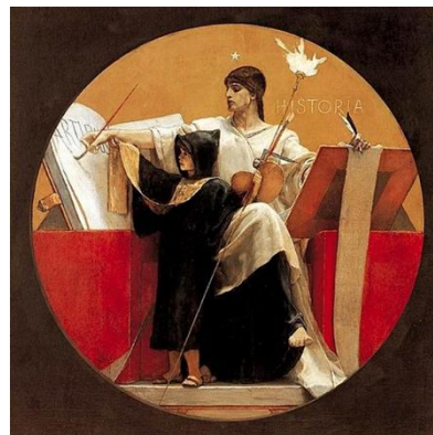
Νικόλαος Γύζης, Η Ιστορία